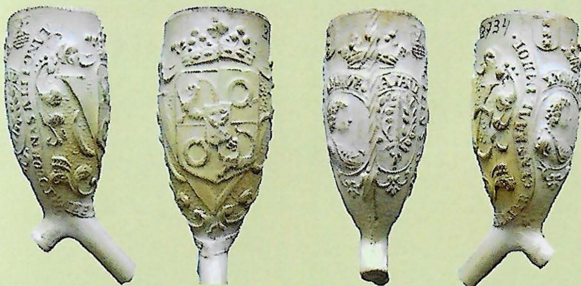
Gelegenheidspijp (1743-1755) ter ere van Gouverneur-generaal Gustaaf Willem van Imhoff. Zie artikel op pagina 2342