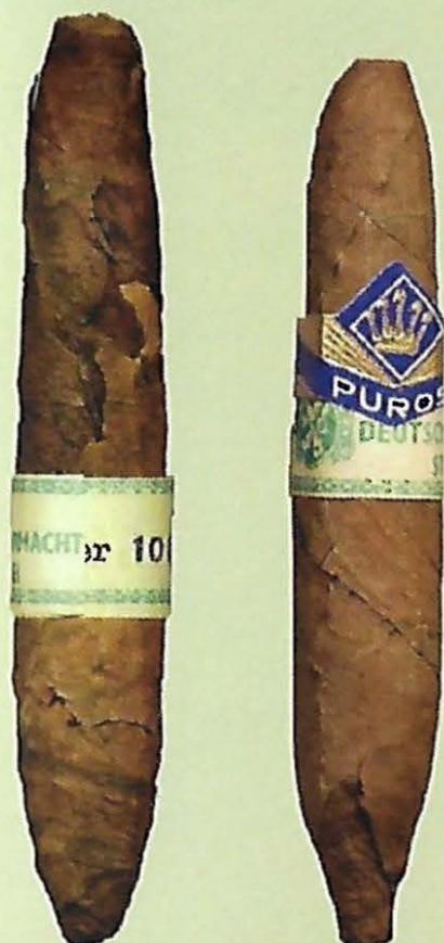
Nederlandse sigaren voor de Wehrmacht. Zie blz. 2333